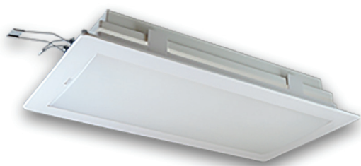
TRQS installé dans le boîtier TRQS/BE (TRQS vendu séparément)